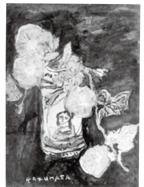
右) 図3 「マジヨリカ壺の朝顔」1971年頃 左) 図4 「マジヨリカ壺の朝顔」1973年