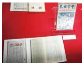
雑誌「中学世界」大正10年6月号