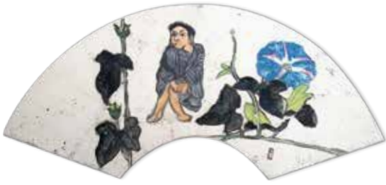
図2 「芭蕉屏風」(部分) 1935年 個人蔵

後者は、芭蕉の句から着想した扇面画十六面を貼り交ぜた「芭蕉屏風」で、その一面が「朝顔に我は飯食う男哉」を題材にし、あさがおが描かれています。敢えて墨で表現した葉の奥から垣間見える着色された花は、朝露を纏うような瑞々しさを感じさせます。一政四十代の筆で、中央