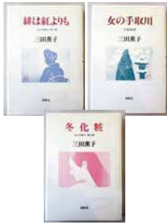
「女の手取川」3部作表紙

また実際に起こった昭和九年手取川の洪水での出来事、商店の様子など昔の美川町が描写され、当時の様子が窺えます。