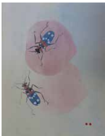
見えないものにも生かされて (2020年)