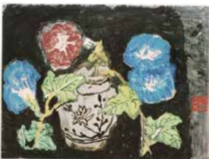
図1 「あさがお」1971年 廣澤美術館蔵

一方、薔薇や向日葵以外にも、椿やチューリップ、鉄線や百合など季節に応じた様々な花を描いている一政に、あさがおを描いた作品は多くありません。そうしたなか本展において本年初公開したのが「あさがお」（一九七二年 廣澤美術館蔵／図1）と「芭蕉屏風」（一九三五年 個人