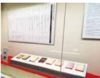
島田清次郎の著作などの展示の様子