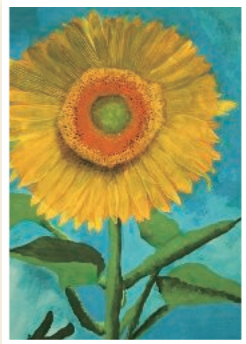
「夏のかがやくひまわり」

ひまわりの絵をかいたとき、みてくれた人があかるいきもちになつてくれたらいいなと思つてかきました。