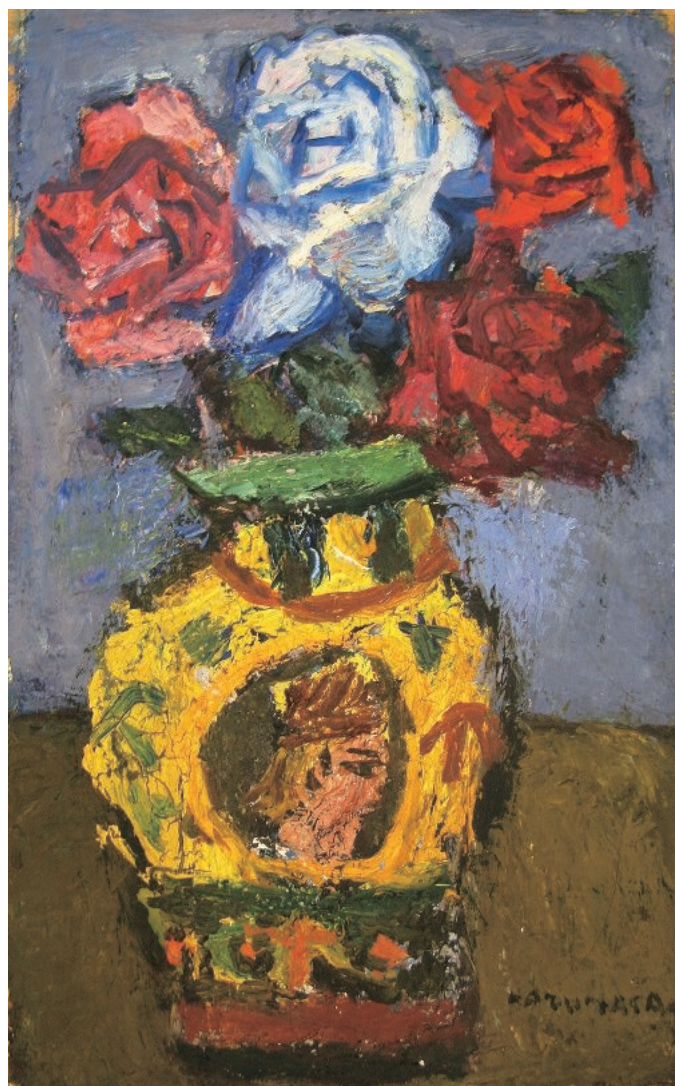
《マジョリカ壺の薔薇》 (1962年 41.7×26.0cm)

それから神戸へ行った時、丈七寸ばかり、マジョリカ壺を買った。(中略) 騎士の顔が丸い輪廓の中にかいてある。これを何枚か描いた。