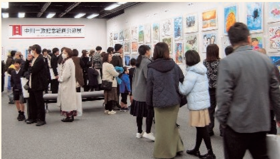
第31回展の様子（市民工房うるわし）