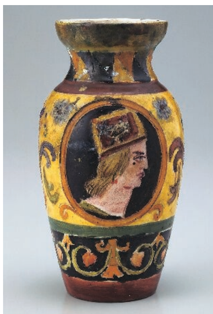
中川一政愛用品 マジョリカ陶器 色絵騎士図壺 (φ 10.8×H20.2cm 16~17世紀)