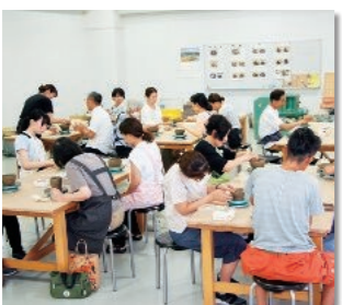
上段右…触ってみる鑑賞会の様子/下段…別館での作品展の様子 上段左…ワークショップの様子

講師の先生に教わりながら自由に作り、陶芸に親しむ一日となりました。できあがった作品は、後日美術館別館で展示しました。(参加者…18名)