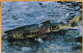
手取川を遡上する鮭

令和5(2023)年5月には、美川地域を含めて、白山市全体が白山手取川ジオパークとして、ユネスコ世界ジオパークに認定されました。白山手取川ジオパークでは、白山から手取川、日本海へ至る中で繰り返される“水の旅・石の旅”をキーワードに、火山や化石、峡谷や扇状地など大地の成り立ちを、自然と人との関わりの中で体感できます。