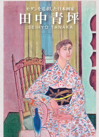
協力（敬称略順不同） アーツ前橋 偕楽園 好文亭 青梅市立美術館 熊本県立美術館 東京都現代美術館 佐久市立近代美術館

田中青坪（1903-1994）は、小茂田青樹に師事し日本画におけるモダンを追求した独特なタッチが人気の日本画家です。たおやかでありながらもはつとするような彩色を施したり、日本画では稀なモデルのポーズで描いたりとその試みの現れを追うだけでも楽しめます。群馬県（現在の前橋市）出身ですが、3歳から東京に住み、1929年、当時多くの軍・政治関係者が居宅や別邸を構えていた物静かな住宅街である杉並区荻窪に転入し、その生涯を荻窪で過ごしました。