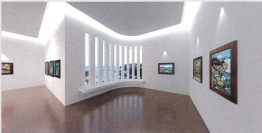
中川一政の展示室 窓外にはアトリエのあった真鶴の景色が垣間見えます。

初期公開の三作家につづき、さらに 2023 年秋、2024 年春にも魅力的な芸術家を紹介予定です。