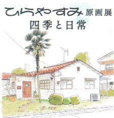
ひらやすみ 原画展 四季と日常

真造圭伍『ひらやすみ』原画展 現在開催中 -四季と日常- 人気マンガ『ひらやすみ』の貴重な手描き原画 55点を展示しています。