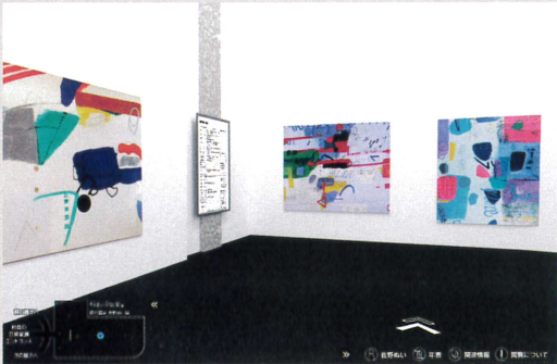
佐野ぬいの展示室 白亜の展示室に、はつらつとした青を中心とした抽象画が映えます。6メートルを超える大きな壁画は圧巻です。