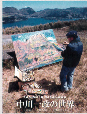
協力（敬称略順不同） 中川モモコ 中川達郎 中川陽介 原夏郎 真鶴町立中川一政美術館 白山市立中川一政記念美術館 公益財団法人泉美術館 南川三治郎