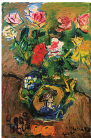
中川一政名作ノ複製:「ローマの街と塔」Majolica Pot and Cassino 1974年 制作:「審美」Borne 1984年 コレクションノ複製:「マジョリカ壺」Majolica Pot 56-57世紀 制作:「大塚節舞臺」Collage of Beito Kikuchi 18世紀